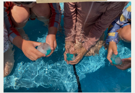
水又はお湯に沈めると…