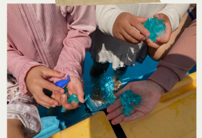
イルカやクリスタルが 出てきた～

お風呂に入って欲しいけど、中々入ってくれないお子様もいらっしゃると思います。これを行うと入りたくないと言っていたお子様も自ら入りたいと言うようになるかもしれません。