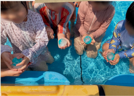
凍った物を持ちます